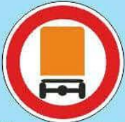
3.32 "Движение транспортных средств с опасными"