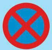
3.27 "Остановка запрещена"