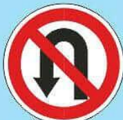
3.19 "Разворот запрещен"