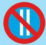
3.30 "Стоянка запрещена по четным числам месяца"