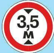
3.13 "Ограничение высоты"