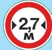
3.14 "Ограничение ширины"