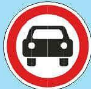
3.3 "Движение механических транспортных средств запрещено"