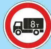
3.4 "Движение грузовых автомобилей запрещено"