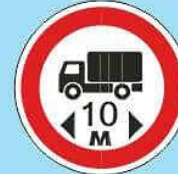
3.15 "Ограничение длины"