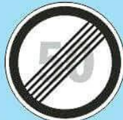
3.25 "Конец зоны ограничения максимальной скорости"