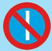
3.29 "Стоянка запрещена по нечетным числам месяца"