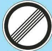
3.31 "Конец зоны всех ограничений"