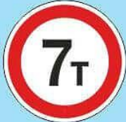
3.11 "Ограничение массы"