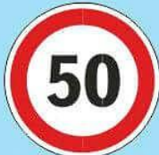
3.24 "Ограничение максимальной скорости"