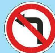
3.17.3 "Поворот налево запрещен"