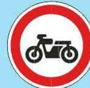
3.5 "Движение мотоциклов запрещено"