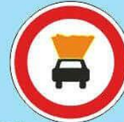
3.33 "Движение транспортных средств с взрывчатыми и"