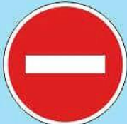
3.1 "Въезд запрещен"