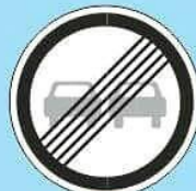
3.21 "Конец зоны запрещения обгона"