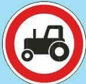
3.6 "Движение тракторов запрещено"