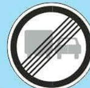
3.23 "Конец зоны запрещения обгона грузовым автомобилям"