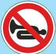
3.26 "Подача звукового сигнала запрещена"