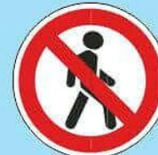
3.10 "Движение пешеходов запрещено"