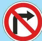
3.17.3 "Поворот направо запрещен"