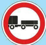
3.7 "Движение с прицепом запрещено"