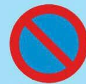
3.28 "Стоянка запрещена"