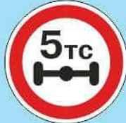
3.12 "Ограничение нагрузки на ось"