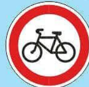
3.9 "Движение на велосипедах запрещено"