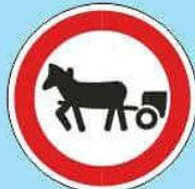
3.8 "Движение гужевых повозок запрещено"