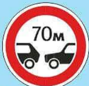
3.16 "Ограничение минимальной дистанции"