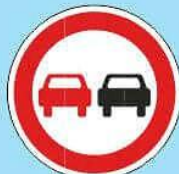
3.20 "Обгон запрещен"