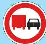
3.22 "Обгон грузовым автомобилям запрещен"